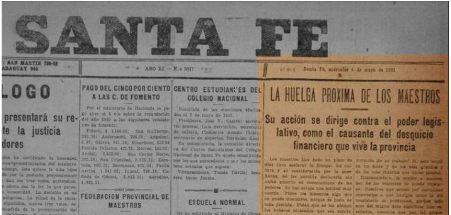
Santa Fe, miércoles 4 de mayo de 1921