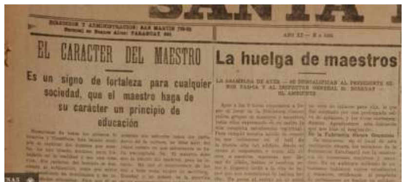
Santa Fe, miércoles 18 de mayo de 1921