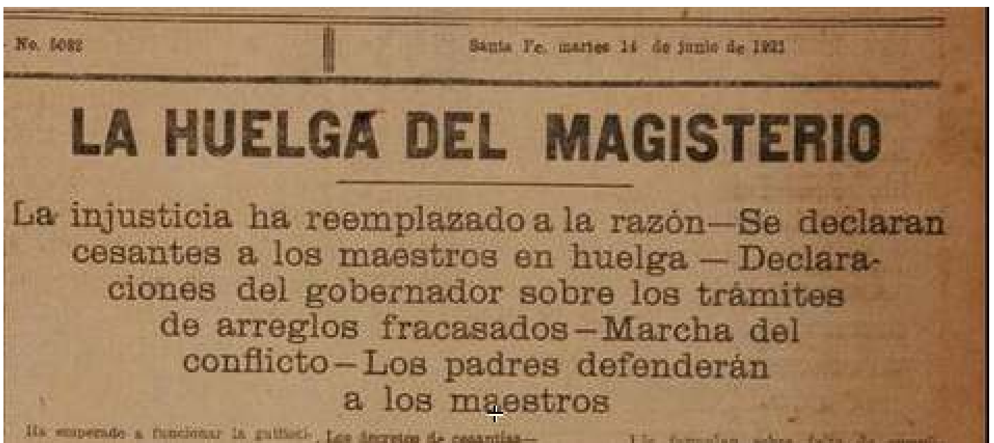
Santa Fe, martes 14 de junio de 1921