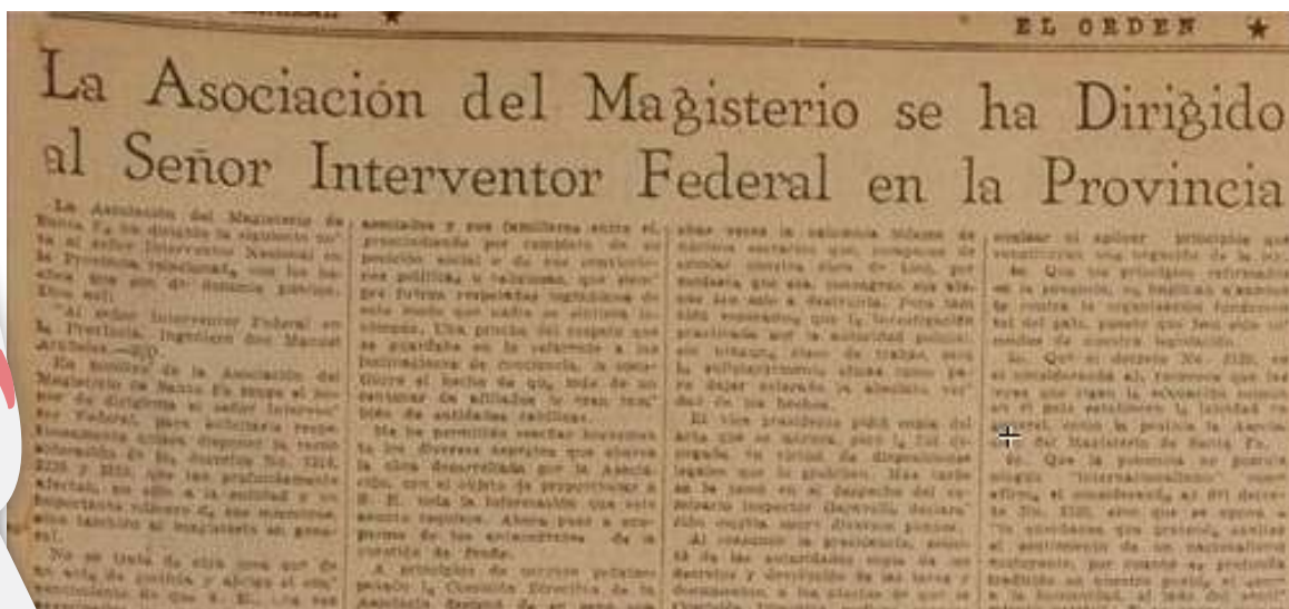
Santa Fe, miércoles 5 de abril de 1944

Un decreto posterior sancionó la disolución de la AMSAFE, produciéndose al año siguiente el cambio de autoridades gubernativas tomando como primera medida, bajo la presión popular, anular lo actuado por las anteriores con respecto a los docentes y la entidad que los agrupaba.