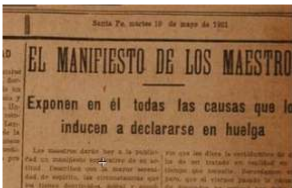
Santa Fe, martes 10 de mayo de 1921