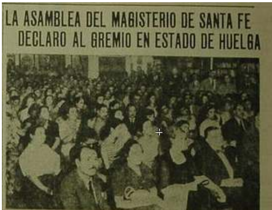
Santa Fe, jueves 21 de febrero de 1957

“La columna de maestros iba marchando por las calles del centro de la ciudad de Santa Fe, y al paso los comercios iban cerrando sus persianas en señal de apoyo a la lucha docente”. Luciano Alonso.