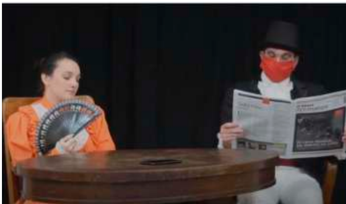
25 de Mayo: "La Revolución está en marcha" https://www.youtube.com/watch?v=xQEnqZkWuWw