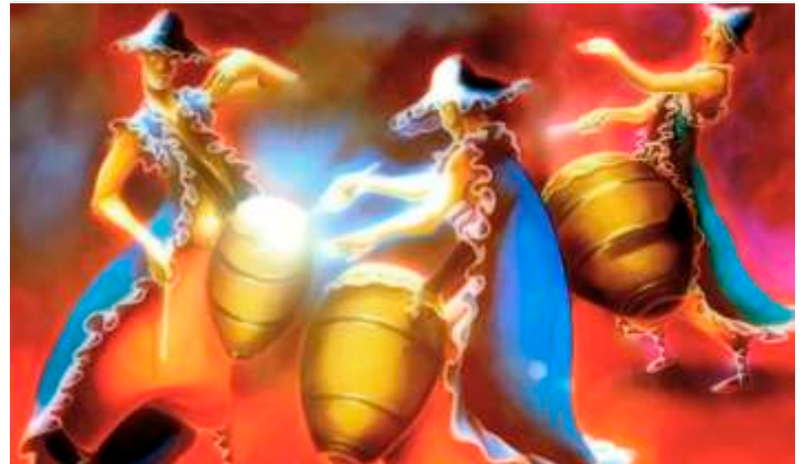
Cachila y los Tambores de Cuareim 1080 Llamada (diálogo de pianos) https://youtu.be/jui8BN_CRQQ