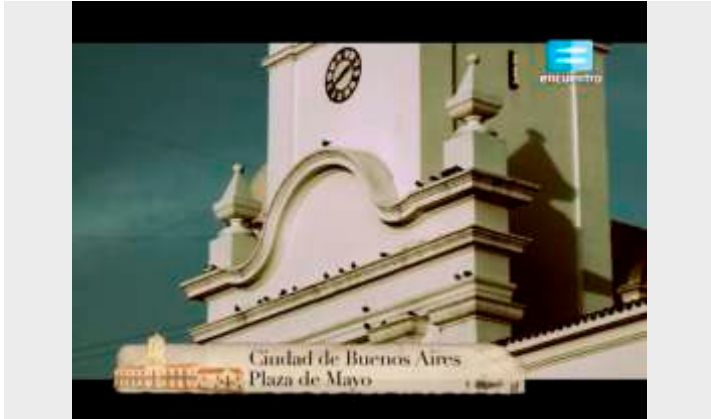
Especiales Historia de un país: 25 de mayo (capítulo completo) - Canal Encuentro https://youtu.be/wZnF_3kyud8