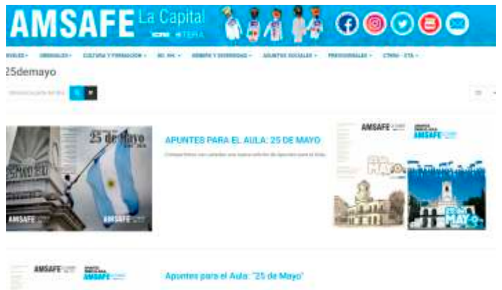
Ediciones anteriores de "Apuntes para el Aula" amsafelacapital.org.ar/index.php/component/tags/tag/25demayo