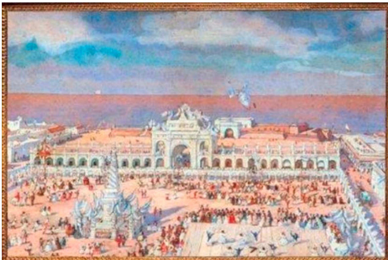
El festejo del 25 de Mayo en Buenos Aires, en 1830, según Matthis