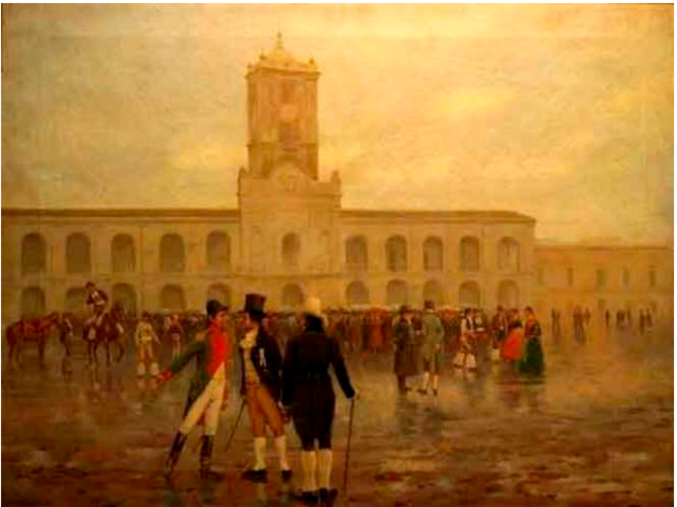
Cabildo de Buenos Aires, óleo de pintor español Francisco Fortuny (1865-1942)

Socializar las producciones en la escuela y/o con la familia.