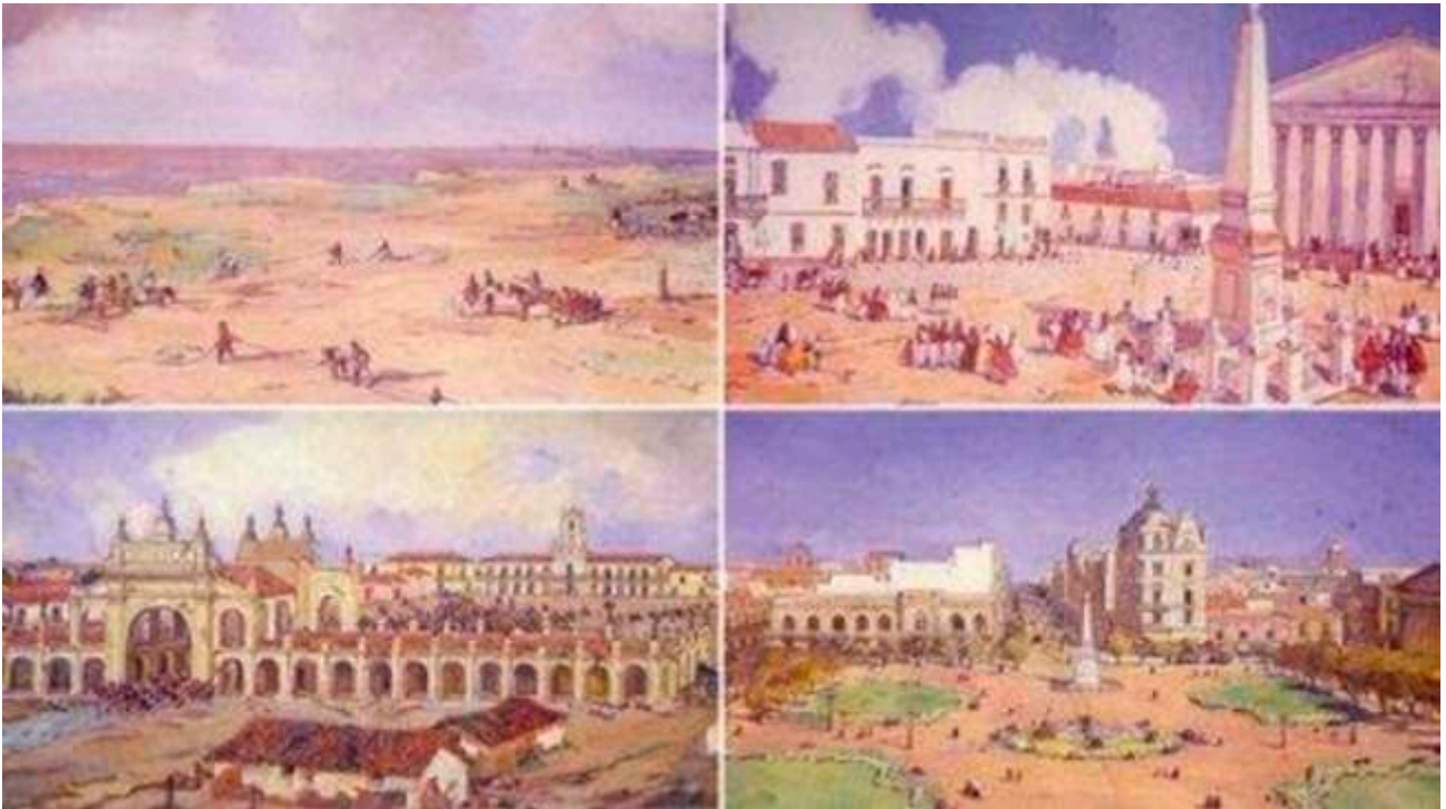
La Plaza de Mayo en diferentes épocas: arriba, siglo XVII; abajo, siglos XVIII y XIX -Léonie Matthis

Te proponemos investigar más sobre Léonie Matthis en