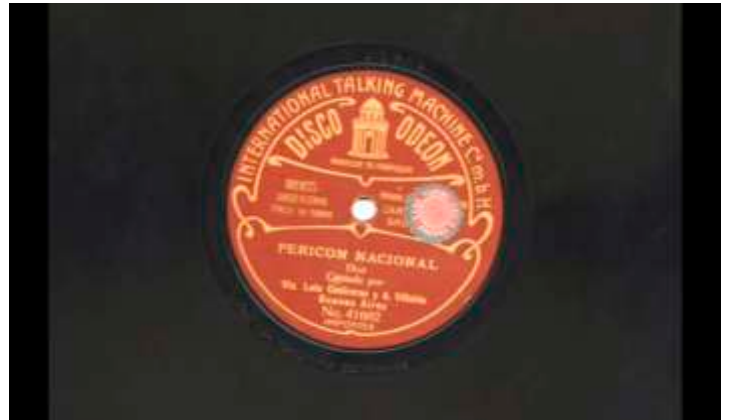
Hermanos Abrodos - Pericón Nacional https://youtu.be/h_IKiB3_ZLQ