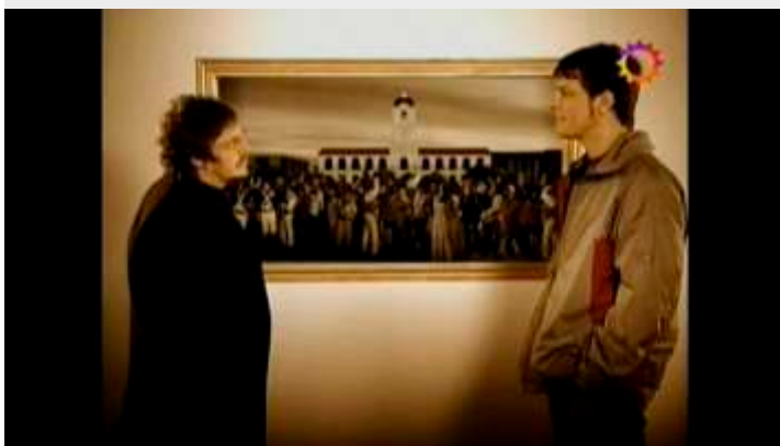
25 de mayo "Algo habrán hecho por la Historia Argentina" https://youtu.be/5o9gdUh3g_k