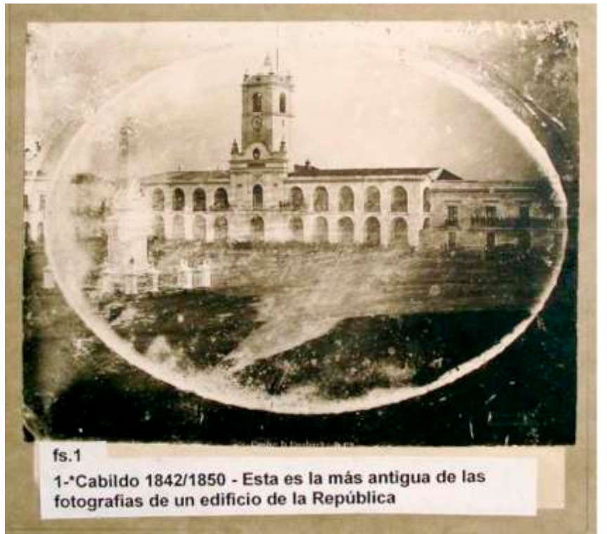
La imagen fotográfica más antigua que documenta al Cabildo en este Daguerrotipo.