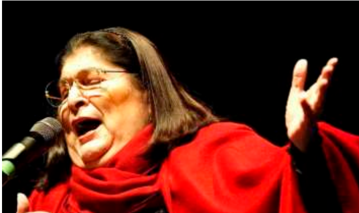
Mercedes Sosa - En Casa De Mariquita https://youtu.be/TBEOSNST7nE