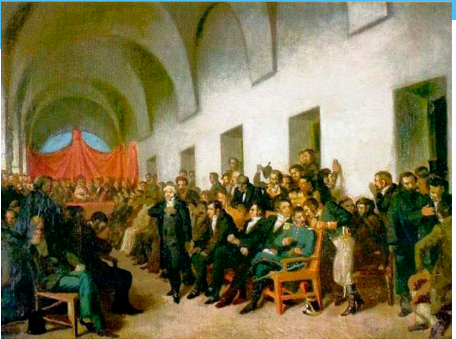
Cabildo, reunión. Óleo de Juan Manuel Blanes (1830-1901, uruguayo). Museo Histórico Nacional, Bs. As