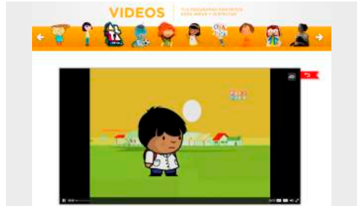
25 de mayo de 1810 La asombrosa excursión de Zamba http://www.pakapaka.gov.ar/videos/50122