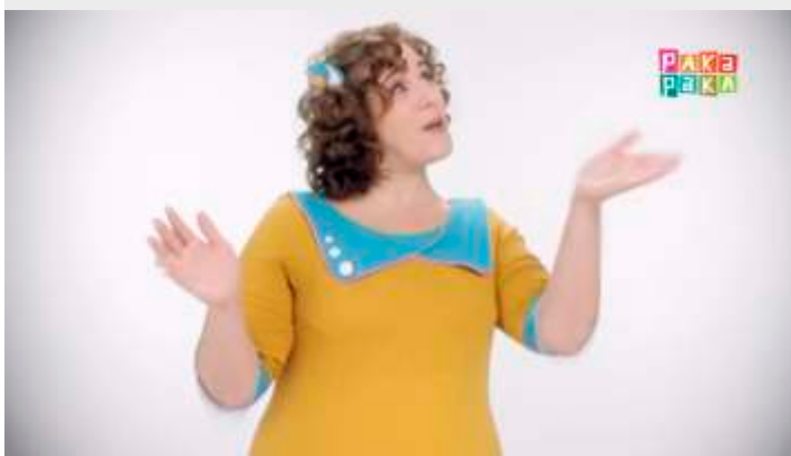
Enseñas: 25 de mayo - Canal Pakapaka https://youtu.be/Zf4WoFUBXRc