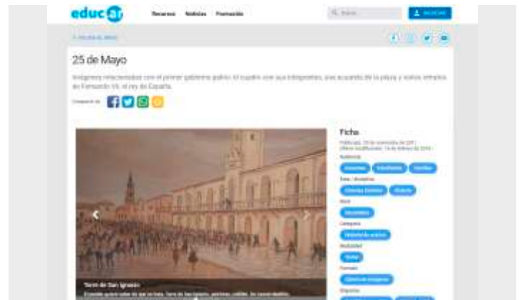
25 de mayo – galería de imágenes https://www.educ.ar/recursos/83877/25-de-mayo