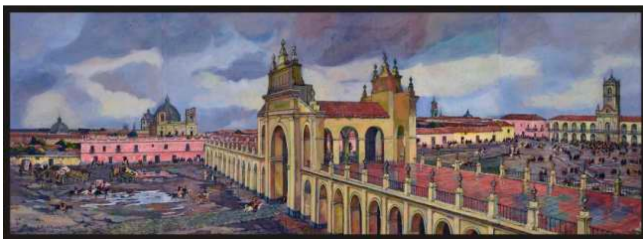
Este cuadro es el número 1 del inventario del Museo del Cabildo – Léonie Matthis