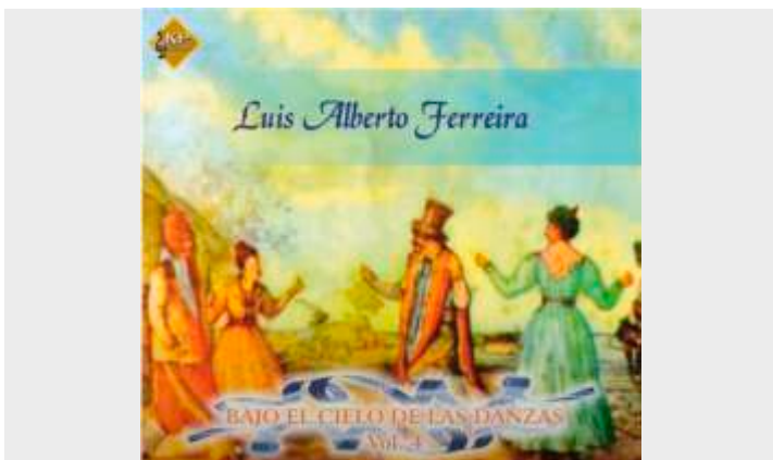
Cielito de la Patria https://youtu.be/9GEG9y_DbGo